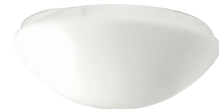
Luminaire STANDARD vendu séparément