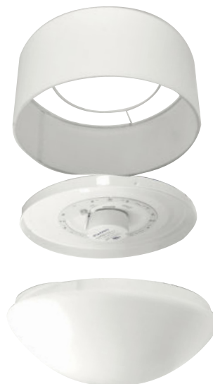
Luminaire STANDARD vendu séparément

Pour l'installation, veuillez vous référer au guide d'installation des luminaires STANDARD.